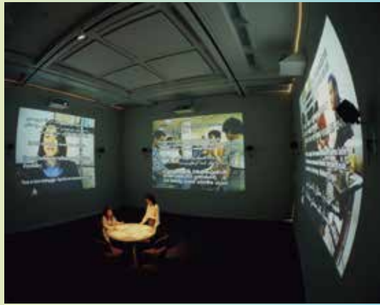
【1】ユン・ヒョングン(尹亨根)[韓国]《茶青色 337-75 #203》1975年 Yun Hyongkeun [South Korea] Umber-Blue 337-75 #203, 1975 【2】作者不詳(チャイナ・トレード)[中国]《広東のコンスタワー邸 #1》19世紀初期 Artist Unknown [China] The House of Conseequa, a Chinese Merchant, Canton #1, early 19th century 【3】キャンディー・バード 崔榮梨[台湾・朝鮮]《アザース—Good Night, and Good Morning》2019年 Candy Bird, Che Yonly [Taiwan / Korea] Others—Good Night, and Good Morning, 2019 【4】岩井成昭[日本]《DIALOGUE》1996-99年 Iwai Shigeaki [Japan] Dialogue , 1996-99