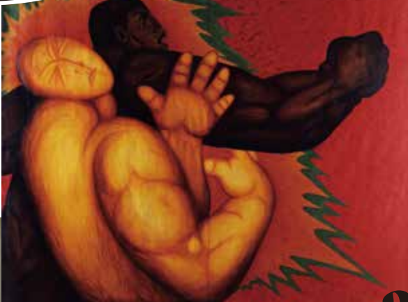
ヤン・マオ・リン(楊朝暉)[台湾] 《空闘》[空闘は心術・闘争の舞]1987年 Yang Mao-Lin [Taiwan] Behavior of Game Playing: Fighting Section, 1987