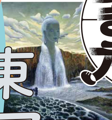
ツェレンナドミディン・ツェグミド [モンゴル]《オルホン河》1993年 Tserennadmidin Tsegmed [Mongolia] Orkhon, 1993