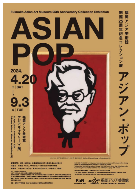
展覧会ポスター画像