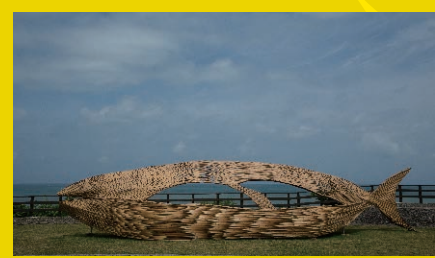
安聖恵 [台湾] 《そこにある海》2018年、台湾東海岸大地藝術館所蔵 ※参考作品 Eleng Luluan [Taiwan] The Sea Over There , 2018, Collection of the TECLandArts Festival

ボートレース福岡の芝生広場では台湾の美術作家・安聖恵による風が吹き抜ける魚のベンチを置き、訪れる皆さまに憩いの場を提供します。