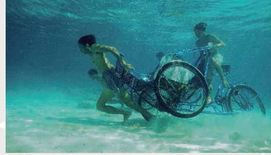
ジュン・グエン＝ハツシバ [日本/アメリカ/ベトナム] 《メモリアル・プロジェクト ナ・トラン、ベトナム - 複雑さへー 勇気ある者、好奇心のある者、そして臆病者のために》2001年、熊本市現代美術館蔵 Jun Nguyen-Hatsushiba [Japan / US / Vietnam] Memorial Project Nha Trang, Vietnam: Towards the Complex - For the Courageous, the Curious, and the Cowards. 2001, Collection: Contemporary Art Museum, Kumamoto, Courtesy: the Artist/ Mizuma Art Gallery, Tokyo, Commissioned by Yokohama Triennale 2001

アーティスト 8 名によって表現された「水」をめぐる多彩な作品を体感していただくことで、アジアの現代アートに触れる一歩となれば幸いです。