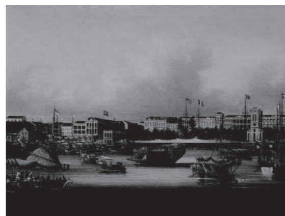
Anonymous (China) "The Hong, Canton" c. 1850

這些繪畫作品，主要是以造訪亞洲的西洋人為對象制作的輸出品或土產，反映西洋買主的異國趣味，具有極富異國魅力的特色。例如，中國廣東地方制作的「中國外銷畫」(China Trade Painting)，英國統治時代的印度首都加爾各答 (Kolkata) 所見的洋風繪畫，以及同樣於印度之東印度公司人士所訂購，稱作公司派 (Company School) 的細密畫等等。