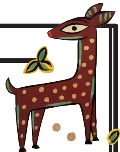
Jamini Roy (India) "Fawn" 1940s (detail)