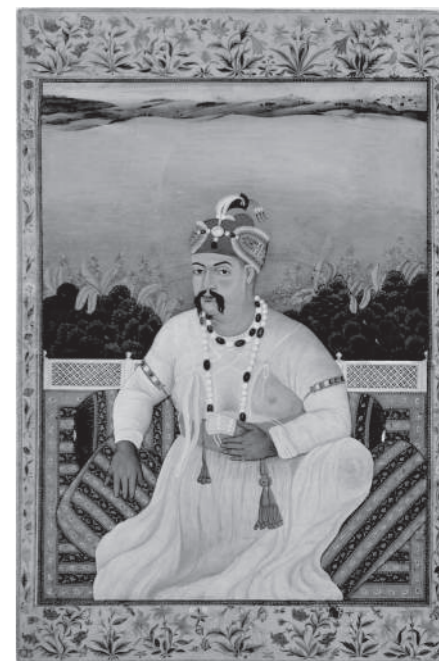
Gobindram Chatterjee (India) "Portrait of Asaf-ud-Daula" early 19th century

19 世紀後的亞洲，受西洋諸國殖民地化，及與西洋通商的過程中，開始制作使用西洋繪畫材料 (油畫、水彩等) 與技法 (遠近法、陰影法等)，以當地人物、風俗、風景、神話等為題材的洋風繪畫。此處介紹亞洲與西洋近代世界相遇時期所產生的洋風繪畫。