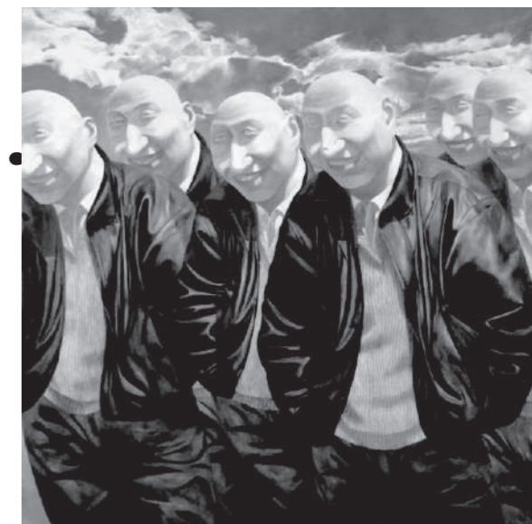
Fang Lijun (China) "Series 2 No.3" 1992

戰後的亞洲，迎接著多樣化與全球化的時代。如此變化，雖隨國家與地域有所不同，但均須面對持續不安定的社會情勢、軍事獨裁政權與對其反抗的民主化運動、經濟自由化與資本主義的弊害、都市與農村的分裂和貧富差距等問題。面對社會的巨大變化，作家們通過作品批判政治，抗議社會不公，著眼於被忽略的微小事物與弱者。1980 年代起，制作出許多以社會問題為題材的作品，特別是 1980 年代末，開始嘗試表演與裝置藝術 (以空間全體構成作品的表現方法) 等的表現方式。