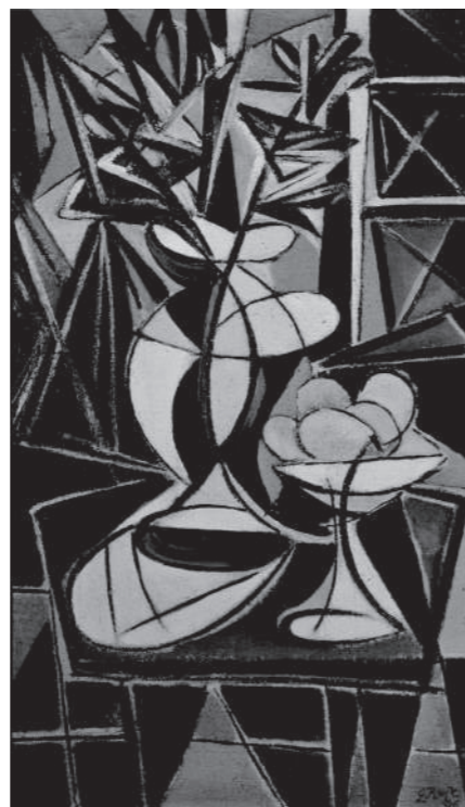
George Keyt (Sri Lanka) "Still Life with Lemons" 1946