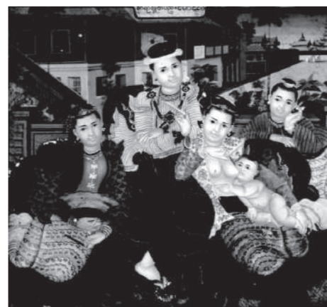
Saya Saw (Myanmar) "Portrait of Royal Family" late 19th - early 20th century

不過，這樣的繪畫作品不僅是為西洋人制作，也逐漸被當地融入西洋生活方式的上流階級人士所接受。英國統治時代緬甸 (Myanmar) 首都曼德勒 (Mandalay) 的宮廷繪師所繪的洋風繪畫即為一例，主要是緬甸貴族奉納給寺院的作品。並且，在民間如印度迦利女神 (Kalighat) 畫、發瑪版畫 (Varma Print) 等般，攝取了西洋陰影法與遠進法的宗教繪畫也逐漸普及。