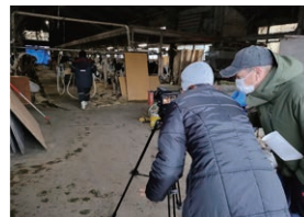
映像制作ワークショップの様子、新作の撮影風景