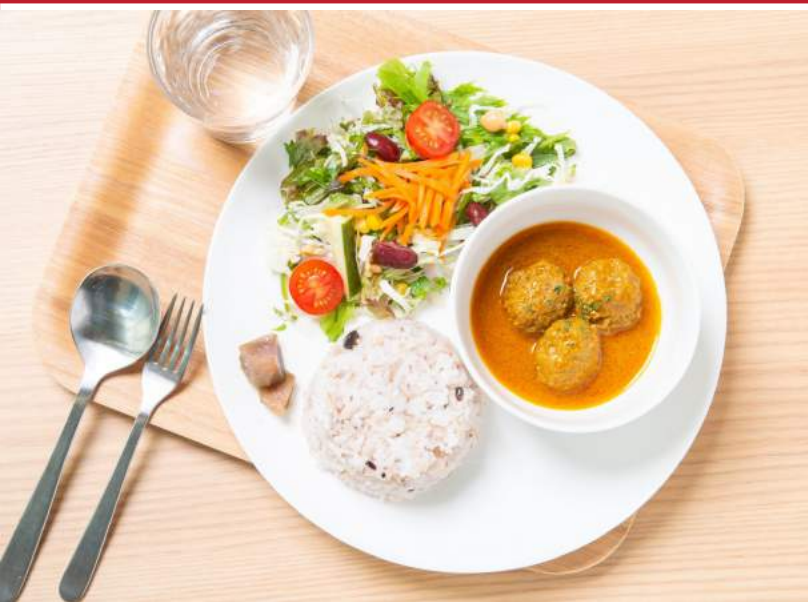
Plate Lunch 100%プレート

生のナッツとドライフルーツを使って作るちょっと不思議な焼かないケーキ。自然の恵みを味わえる満足度の高いスイーツです。