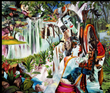
横尾忠則《悠久の愛》1991年