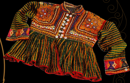
《子ども用衣装》(グジャラート州カッチ) 1980年 岩立フォークテキスタイルミュージアム