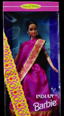
《インドのバービー人形》 1995年 杉本良男コレクション © 2011 Mattel, Inc. All Rights Reserved.

インドに すっかり魅了 されてしまった！ そんな日本のア ーティストの作 品と個人コレク ターの秘蔵イン ドコレクション を一堂に公開し ます。 1960年代以降、 毎年のように インドに足を運 びつづける彼／ 彼女たちは、「混 沌のインド」か ら、いったいど んな発見をした のでしょうか？ 本展では、こ うした日本人た ちのインドの視 覚表現の魅力を 見抜く眼力とそ の美意識に迫り ます。