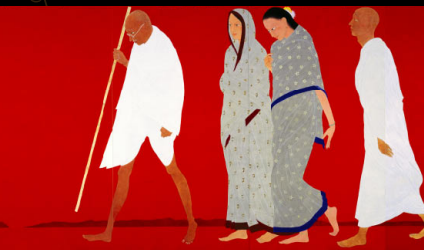
畠中光享《塩の行進》(部分) 2007年 個人蔵