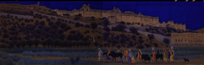
平山郁夫《故城下村民婦牧図》 2002年 佐川美術館蔵